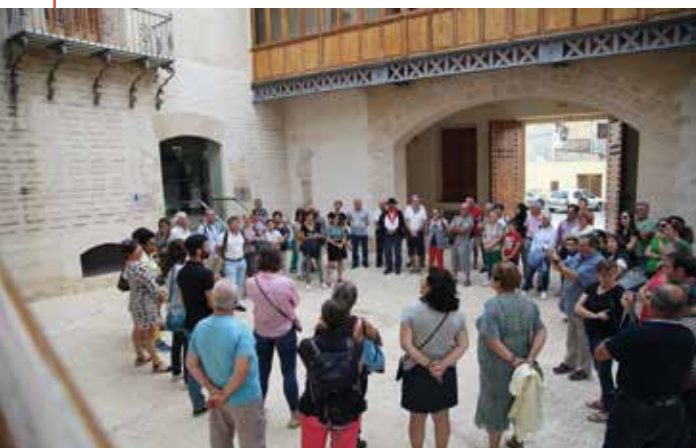
Présentation de la Mairie, ancien Palais DUCAL