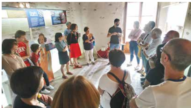
La touche « touristique » agrmente toujours les voyages entre Aiello de Malferit et Vals-près-le-Puy. Les lieux remarquables ne manquent pas autour de nos deux villes.