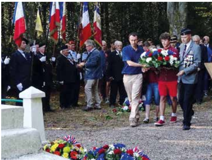
Cérémonie bois de la Rappe (Baccarat)

Les monuments aux morts sont des tombeaux vides, qui ont représenté un véritable effort collectif . Ce sont des constructions érigées sur l'espace public, qui permettent d'honorer et de rappeler le souvenir des soldats tués pour fait de guerre.