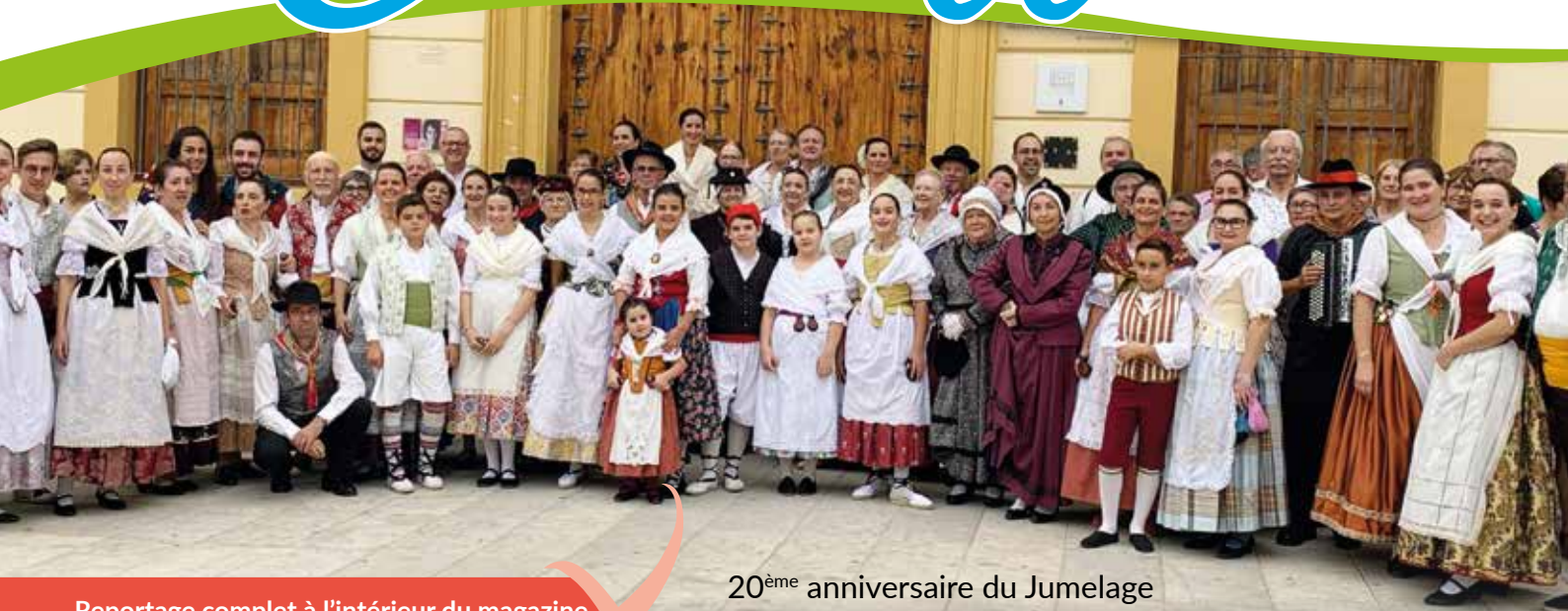
20 ème anniversaire du Jumelage

Reportage complet à l'intérieur du magazine