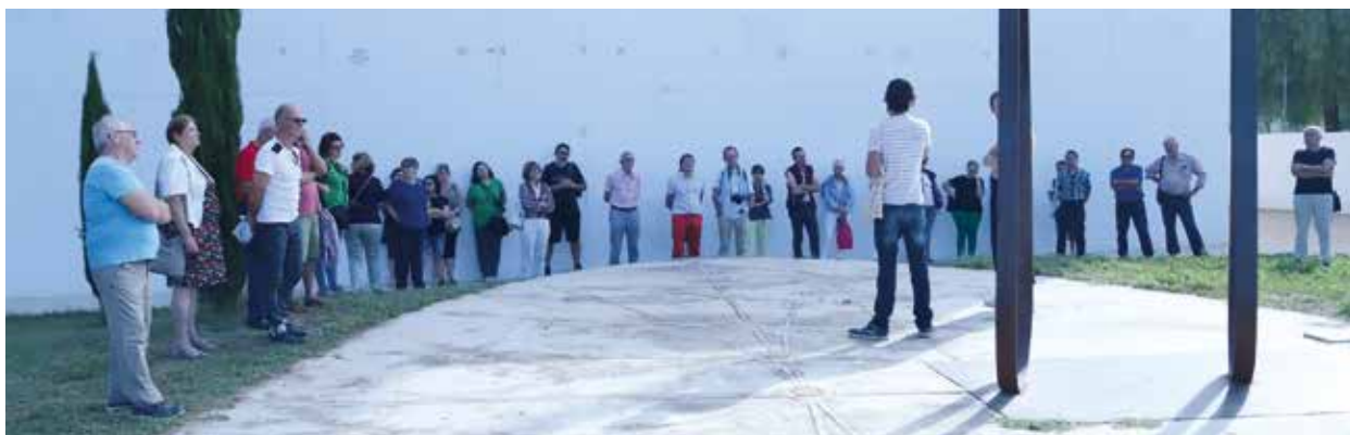
Visite du village d'Otos et de ses cadrans solaires